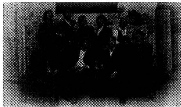
Orchestra Bailam e Compagnia di Canto Trallalero