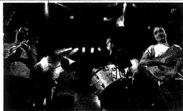
Orchestra di Fubà